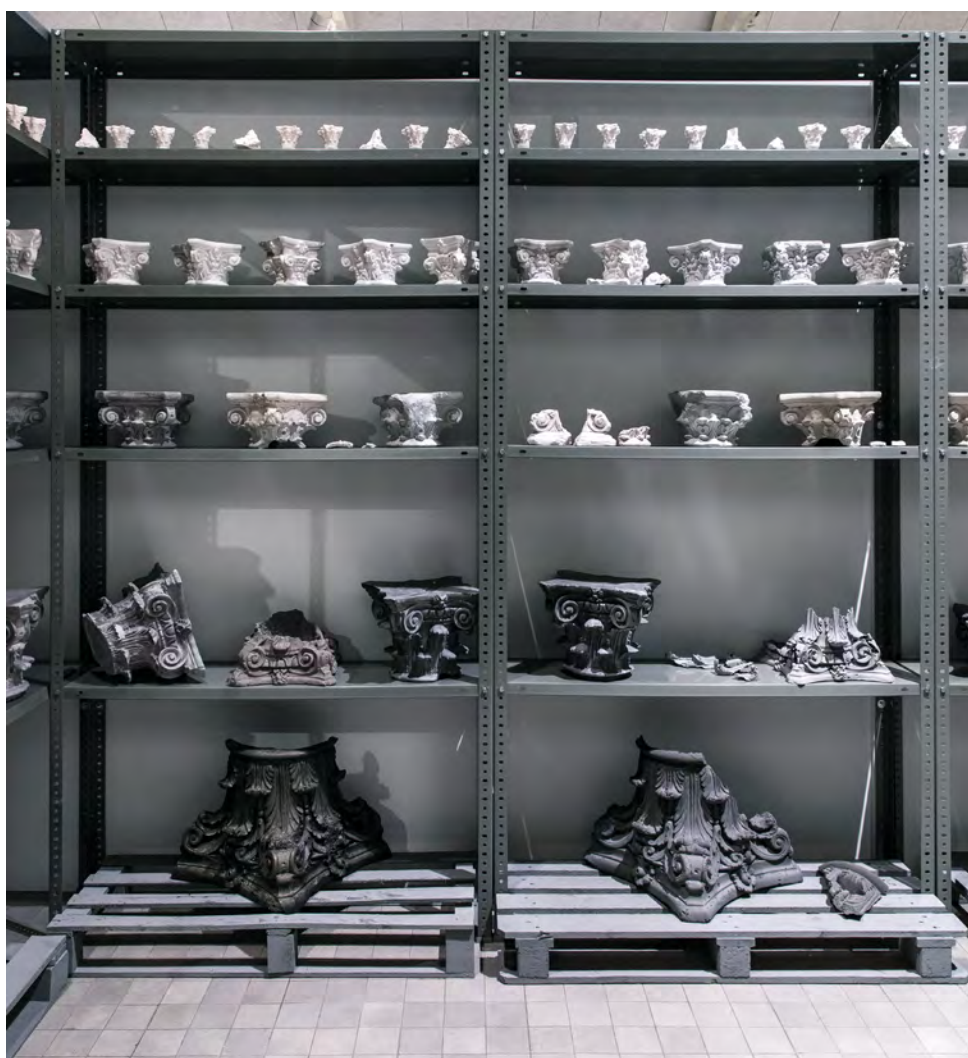
Antonio Fernández Alvira Elementos para un discurso , 2018 Instalación

Estos proyectos pugnan por el pensamiento crítico, por la capacidad de desvelar lecturas tras la superficie, de despojar lo emocional, de desescalar hasta la raíz en pro de la verdad, si es que esta existe. Se trata de releer el mundo y recontextualizarlo, y, por qué no, de ampliar discursos y significados.