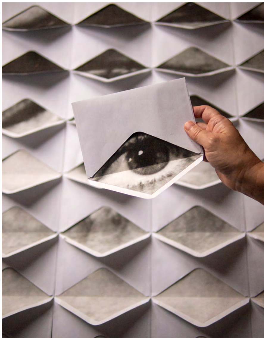
Susana Blasco Ardua , 2021 Prueba preliminar de la intervención en sala Collage 300 x 500 cm

Estas imágenes ahondan en la psique y consiguen conectarnos con nuestro inconsciente revelando sentimientos que nos remiten a nuestros anhelos, incluso a lo sentido pero no vivido.