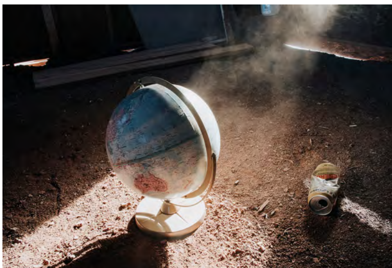
Ana Escario On the Road , 2017 Impresión con tintas pigmentadas en papel PhotoSatin RC sobre Dibond 80 x 120 cm

El cuaderno de apuntes opera como un instrumento de campo para el artista que vive y crea sin diferenciar límites. Un diario visual puede surgir de un viaje físico o de uno introspectivo. La soledad y el silencio resultan ingredientes esenciales para este ejercicio de catarsis donde bucear para perderse o tal vez para encontrarse.