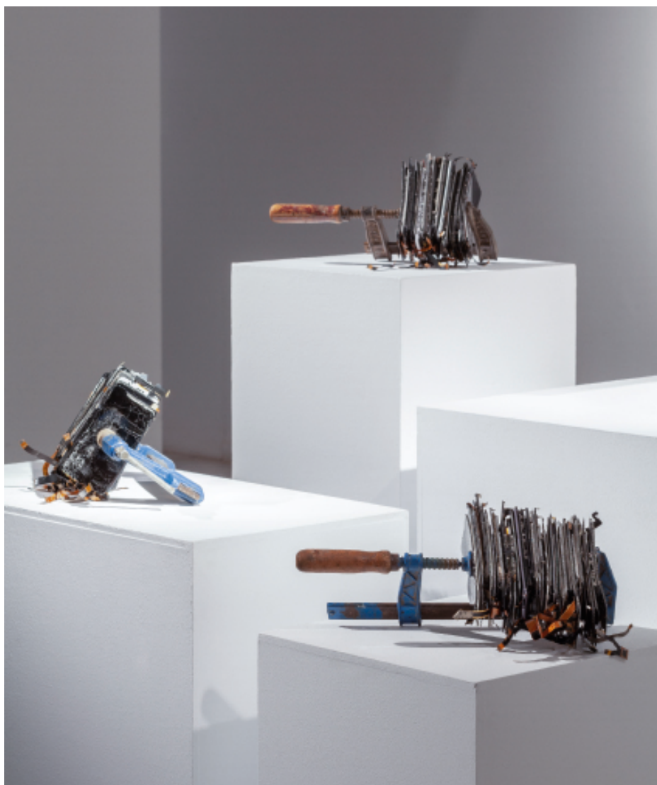
Jorge Isla Still Life , 2019 Sargentos y pantallas de móviles Dimensiones variables

La violencia simbólica introducida en la cultura no asesina ni amputa; sin embargo, se utiliza para ratificar discursos y reafirmar posicionamientos. De modo similar se observa la presión que el entorno digital ejerce en nuestro quehacer cotidiano.