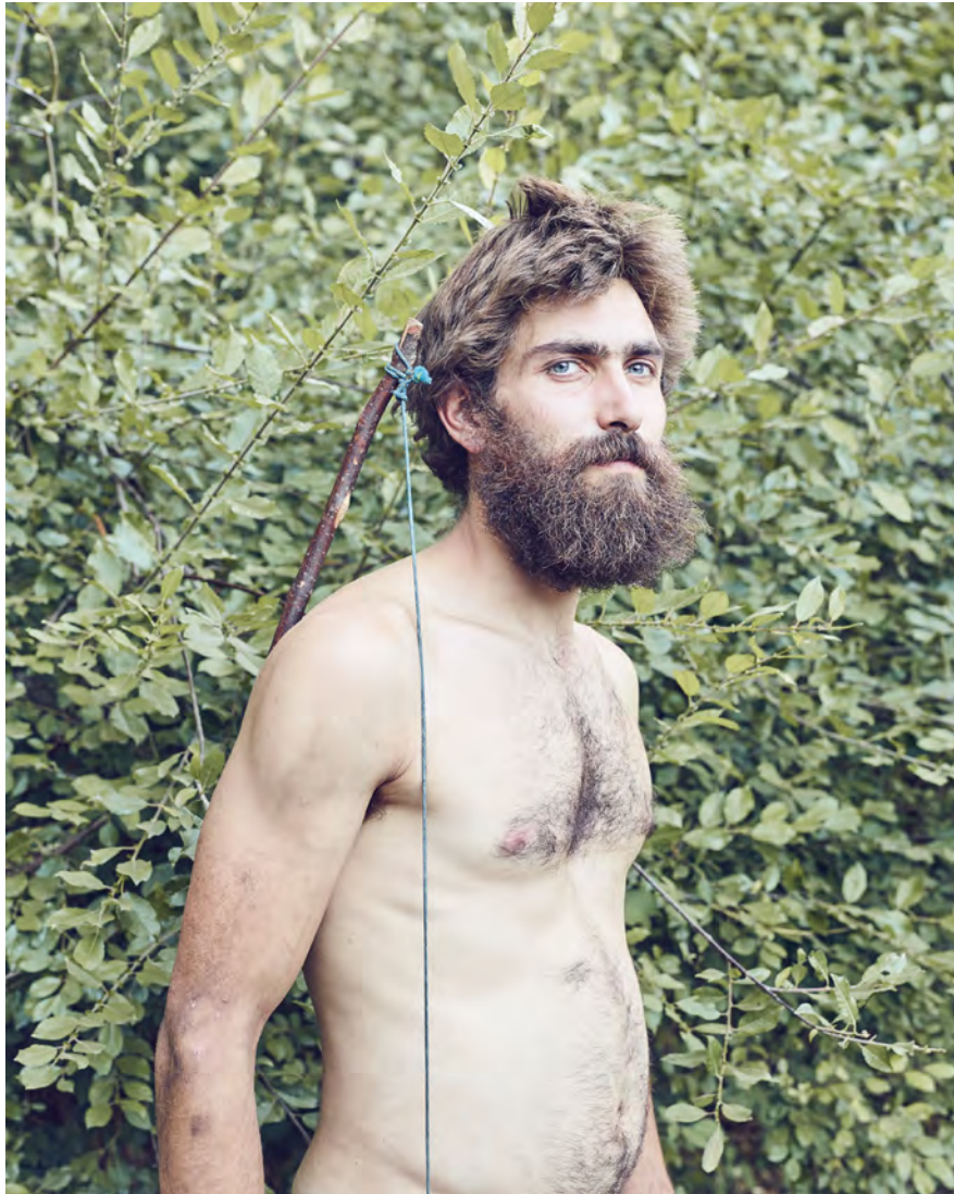
Jorge Fuembuena Wood Stories , 2013 Impresión cromogénica sobre Diasec 156 × 125 cm

Ecosistema, cultura, política... son temas que subyacen en estas obras y nos cuestionan qué parte de nosotros pertenece todavía a lo natural y en qué grado hemos desnaturalizado nuestra esencia.